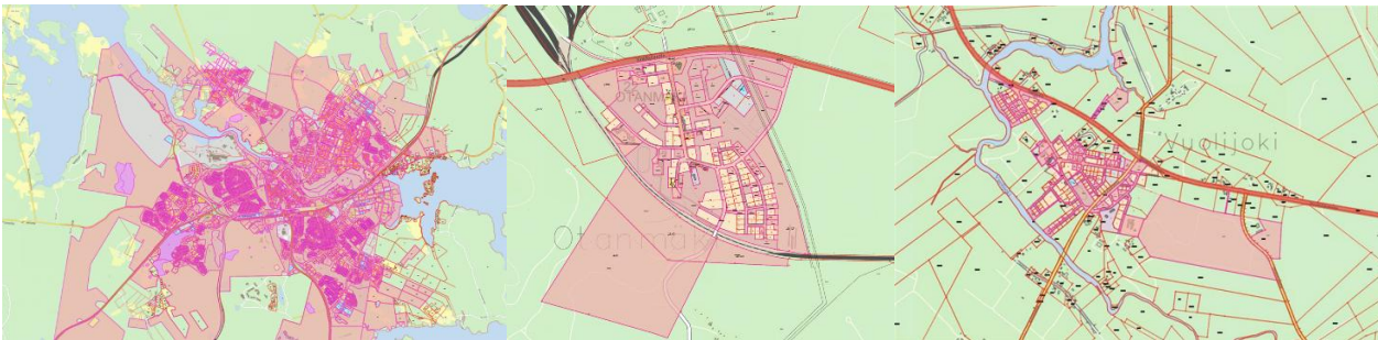
Kuva 3. Kaupungin maaomaisuus 2025. Ylhäällä Kajaanin kaupungin maaomaisuus. Alapuolella vasemmalta lukien keskusta-alue, Otanmäki ja Vuolijoki.