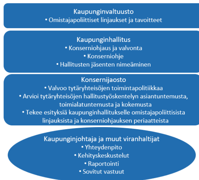
Kuva 2. Toimivallan jako konserniohjauksessa

Kaupungin omistajapolitiikan ohjauksesta ja valvonnasta sekä operatiivisesta toiminnasta vastaavien henkilöiden ja toimielinten työn- ja vastuunjakoa sekä raportointijärjestelmät on määriteltävä yksiselitteisesti kaupungin konserniohjeessa ja sisäisen valvonnan ja riskienhallinnan ohjeessa. Toimivan johtamis- ja ohjausjärjestelmän lisäksi aito yhteistyö ja sitoutuminen asetettuihin tavoitteisiin ovat ehdoton edellytys kaupungin menestymiselle.